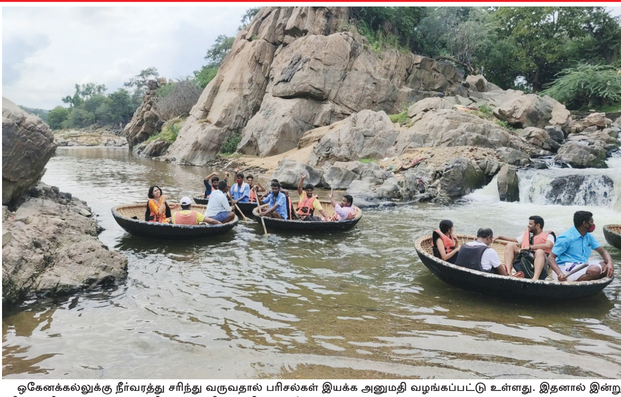
ஓகனேக்கல்லுக்கு நீர்வரத்து சரிந்து வருவதால் பரிசீலனை இயக்க அனுமதி வழங்கப்பட்டு உள்ளது. இதனால் இன்று பரிசீலனையில் சுற்றுலாப் பயணிகள் பயணித்து மகிழ்ந்தனர்.